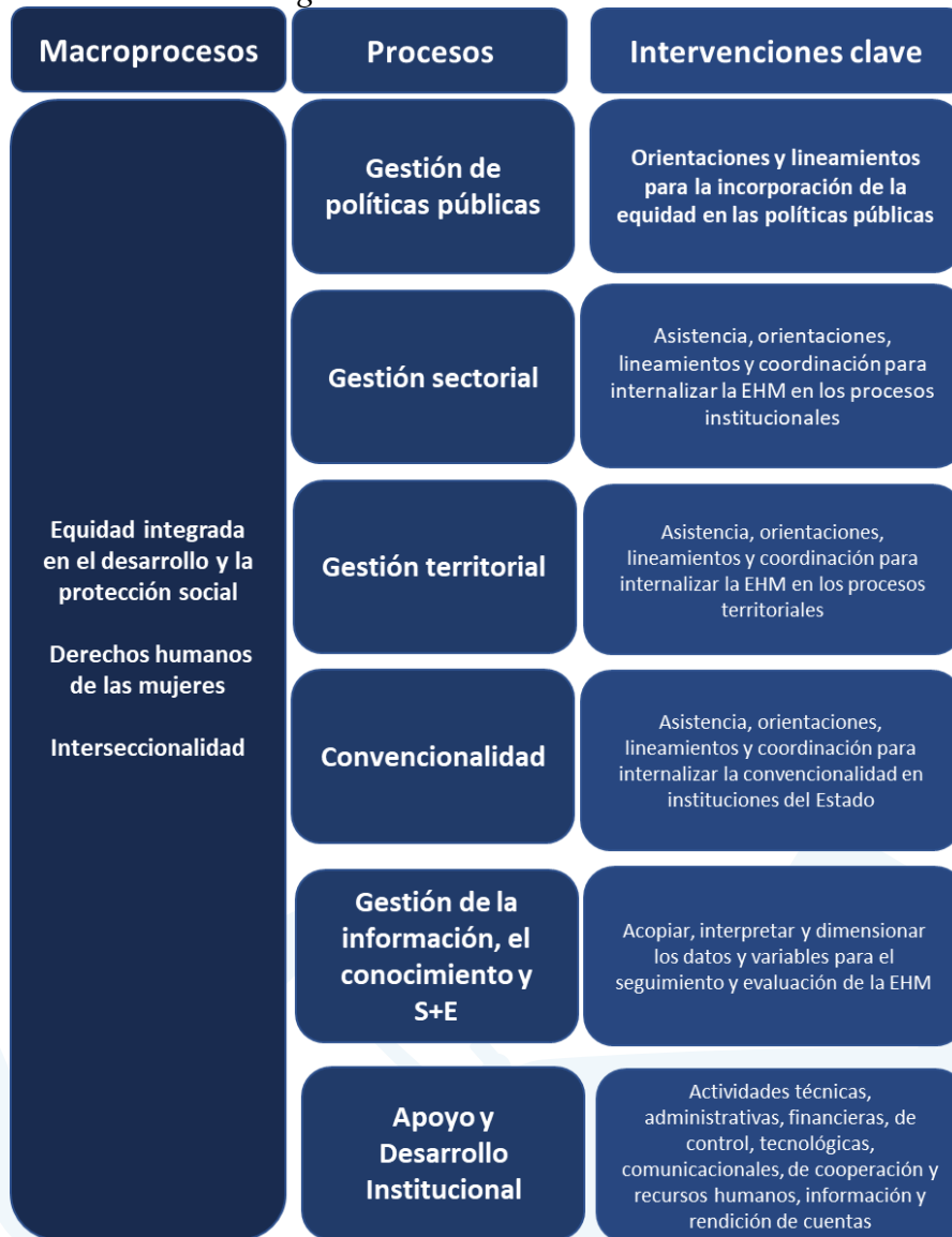
Diagrama 1. Gestión institucional